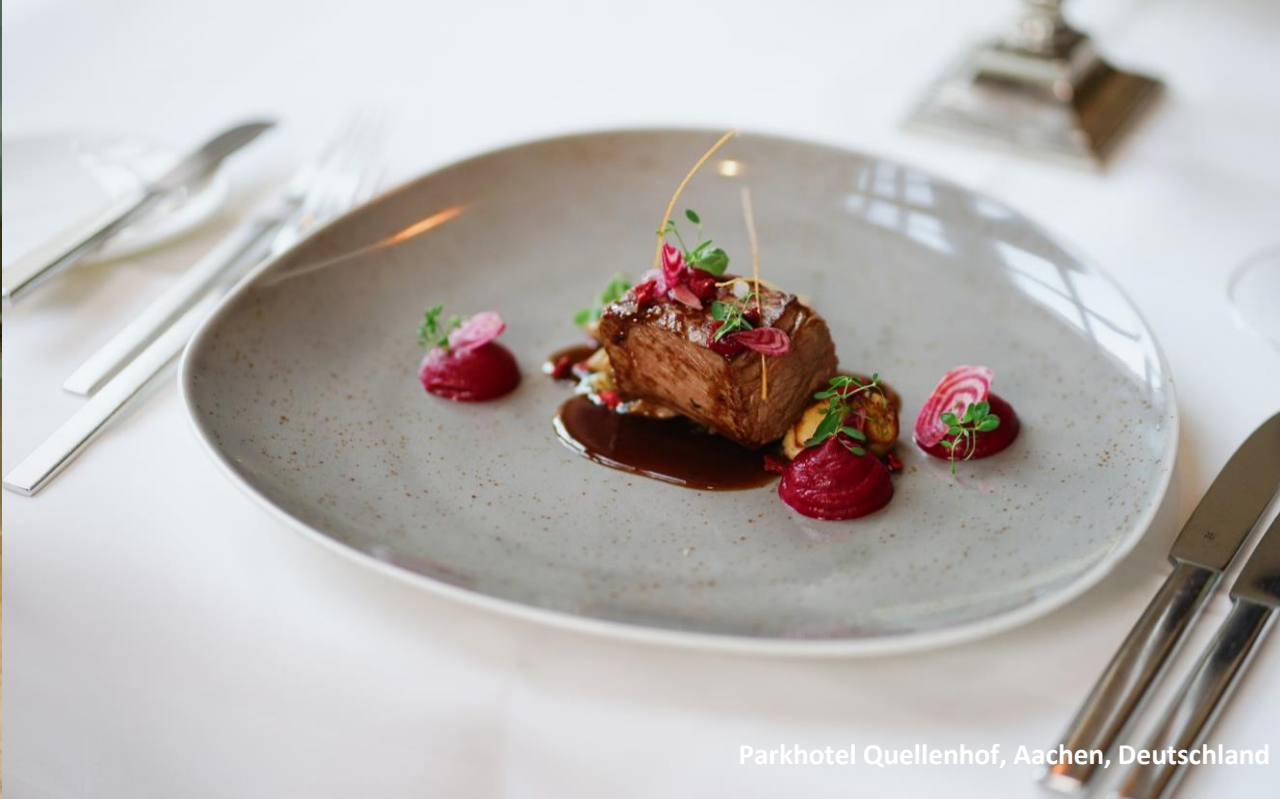
Parkhotel Quellenhof, Aachen, Deutschland