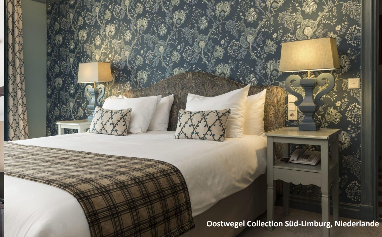
Oostwegel Collection Süd-Limburg, Niederlande

Maesse Private Solutions ist Ihr persönlicher Inspirationsgeber für die nächste Reise!