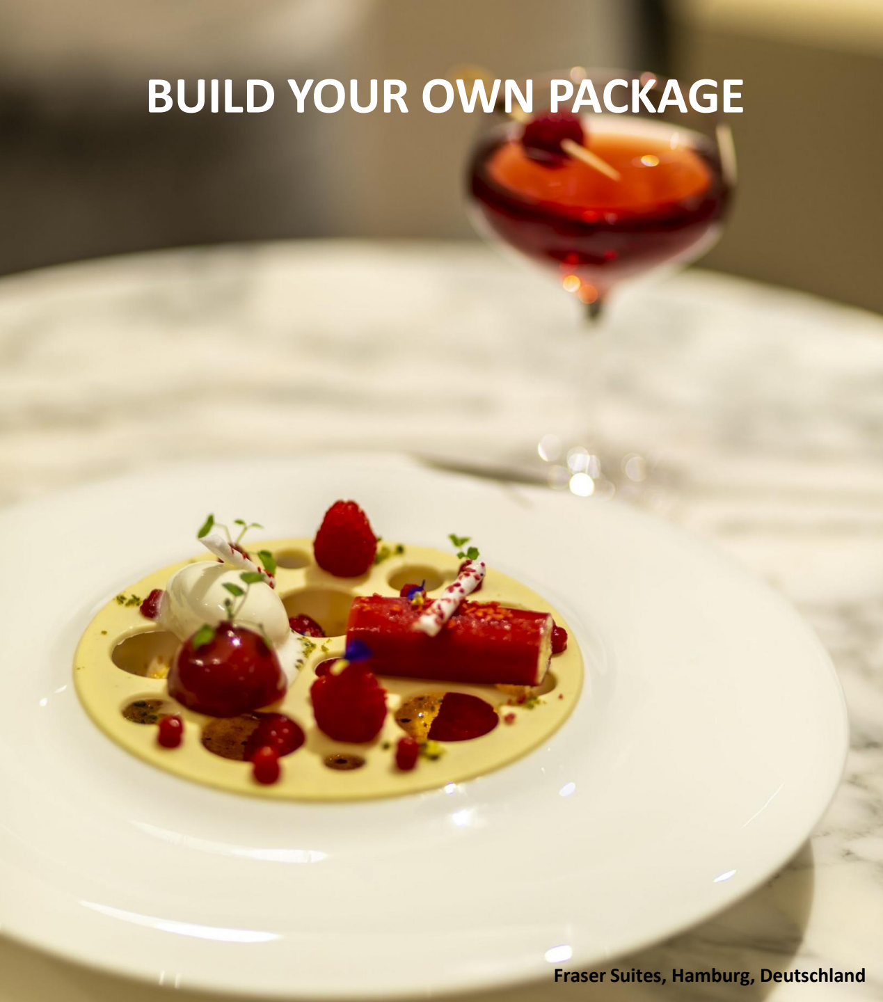
Fraser Suites, Hamburg, Deutschland