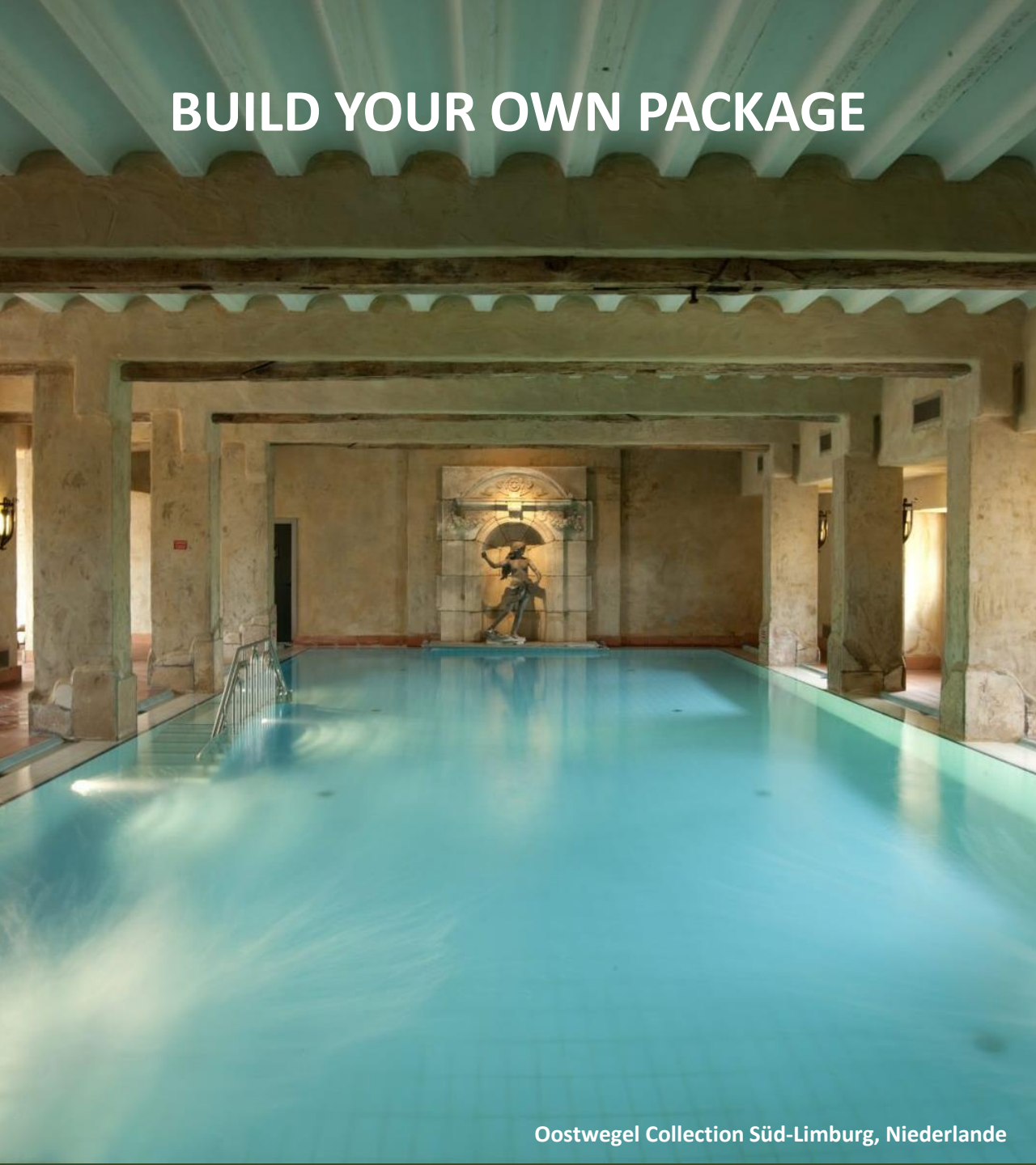
Oostwegel Collection Süd-Limburg, Niederlande