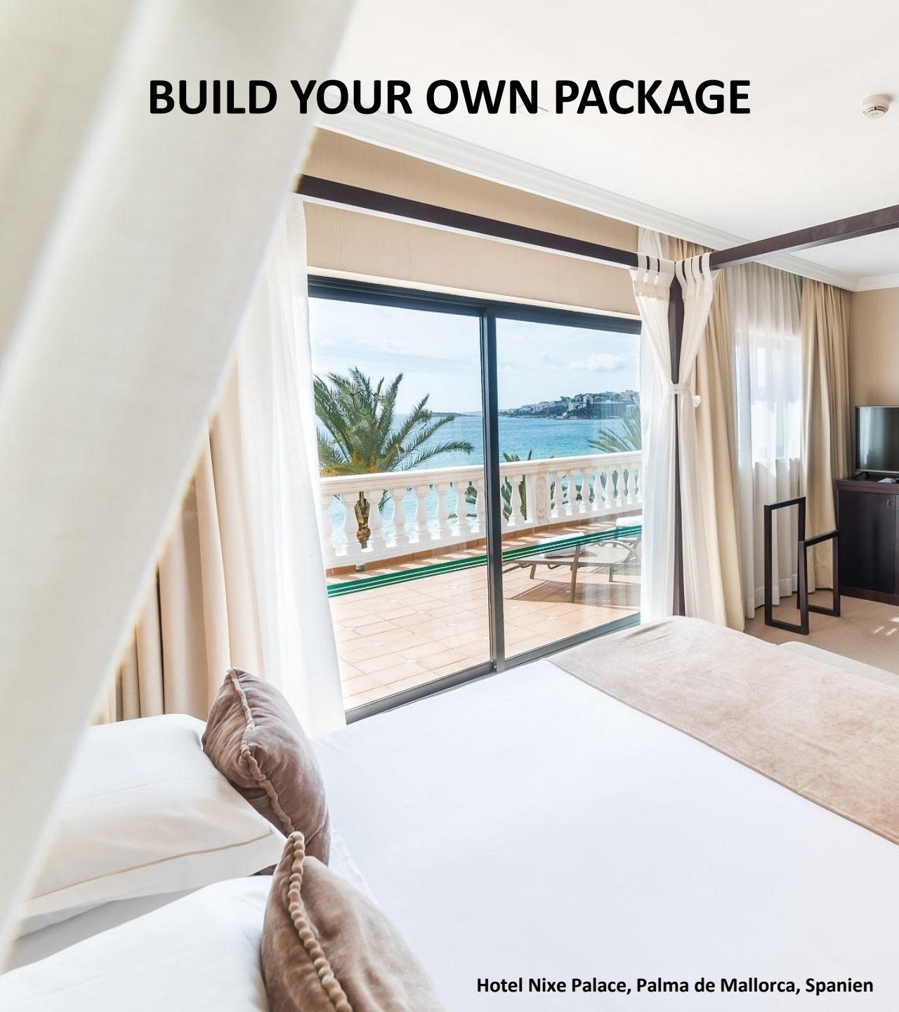
Hotel Nixe Palace, Palma de Mallorca, Spanien