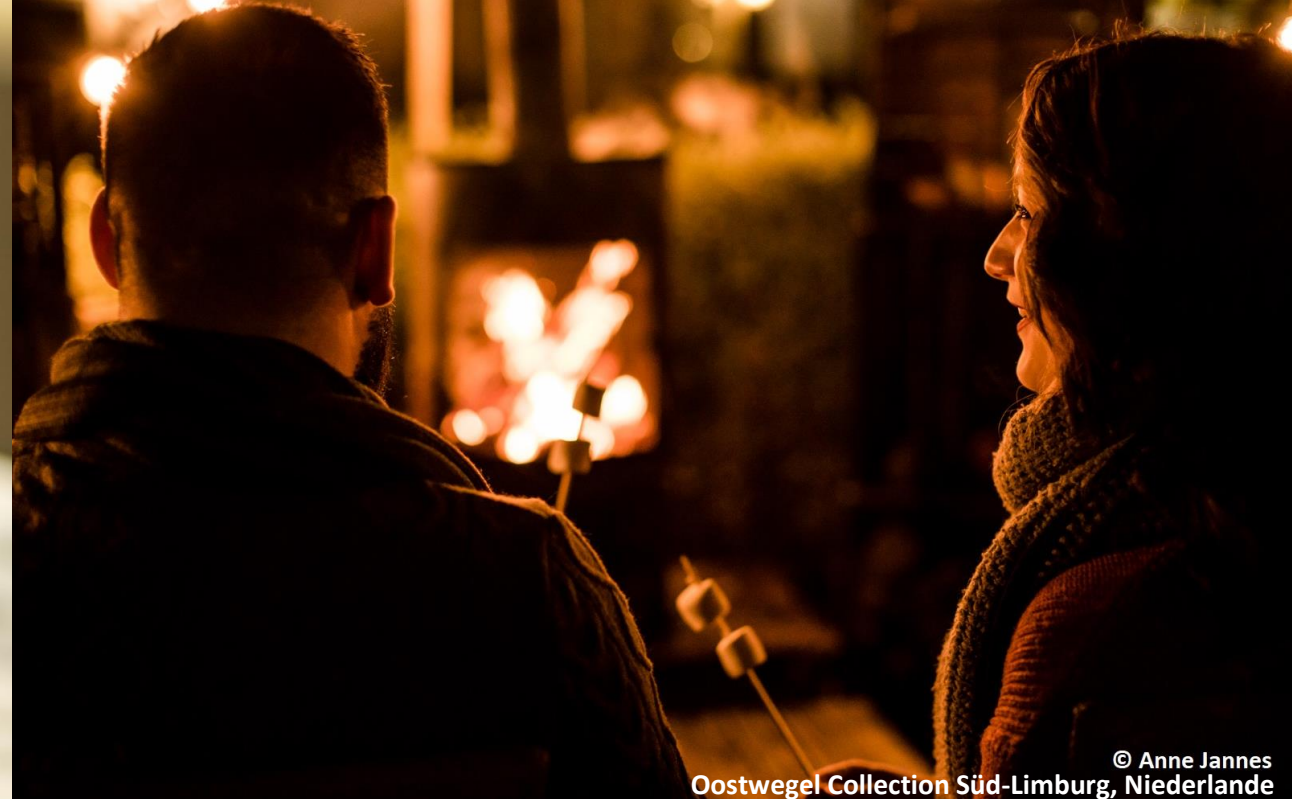
© Anne Jannes Oostwegel Collection Süd-Limburg, Niederlande

Lassen Sie uns wissen, wonach Sie suchen und unsere Reiseexperten erstellen Ihnen auf Anfrage sehr gerne ein individuelles Erlebnis-Package, basierend auf Ihren persönlichen Vorstellungen.